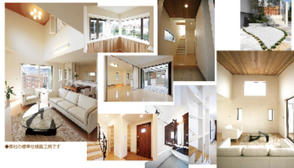
◆弊社の標準仕様施工例です

基礎は、スラブコンクリート厚さ150mmのベタ基礎に、配筋はすべてD13mmを使用。建物は、構造用合板12mm+フロア12mmの剛床仕様で火打梁をバランス良く配置する事で水平線断力を耐力壁等の垂直構面に分配するだけでなく、耐力面材「モイス TM」全面貼りを標準採用し在来軸組工法の柔軟性と可変性に加え垂直構面の強さで、住まいを守ります。食洗機付システムキッチンや浴室暖房乾燥機付バスなど、多彩な標準仕様も見逃せません。