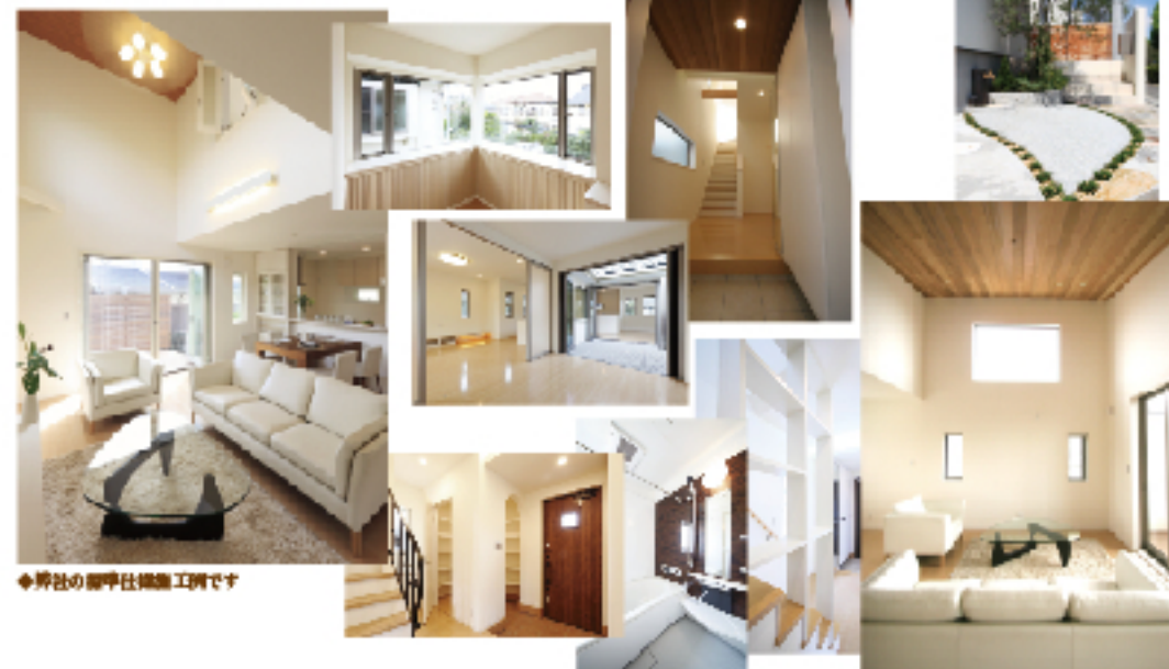
◆弊社の標準仕様施工例です

基礎は、スラブコンクリート厚さ 150mm のベタ基礎に、配筋はすべて D13mm を使用。建物は、構造用合板 12mm + フロア 12mm の剛床仕様で火打撃をバランス良く配筋することで水平揺動力を耐力壁等の垂直構面に分配するだけでなく、耐力面材「モイス TM」全面貼りを標準採用し在来軸組工法の柔軟性と可変性に加え垂直構面の強さで、住まいを守ります。食洗機付システムキッチンや浴室暖房乾燥機付キバスなど、多彩な標準仕様も見逃せません。